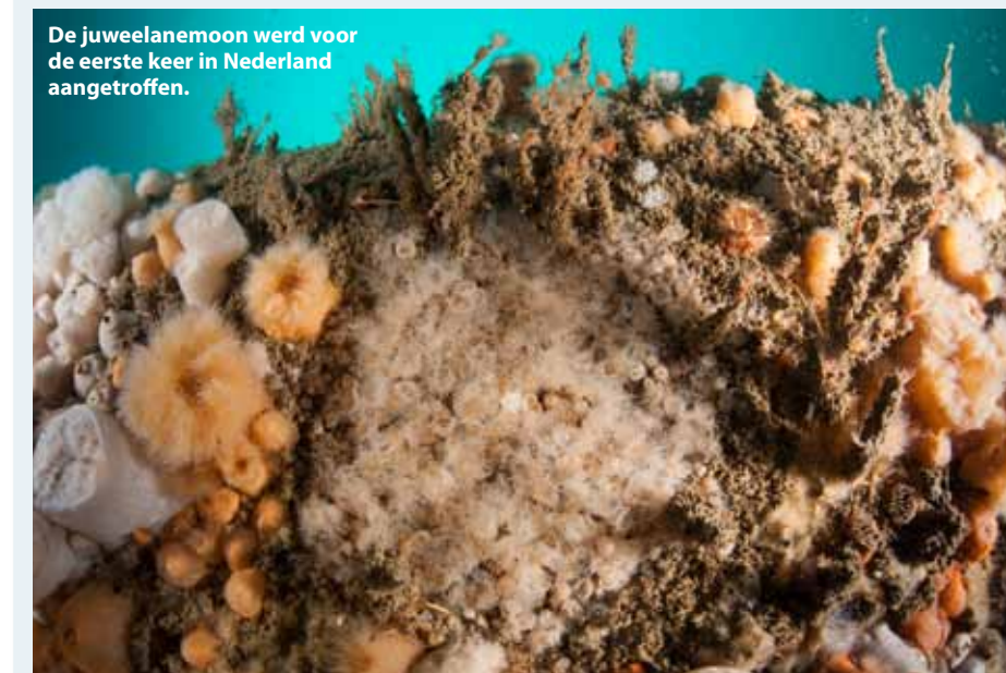
De juweelanemoon werd voor de eerste keer in Nederland aangetroffen.

Een zeer zeldzame kleurvariant van de sierlijke sliabanemoon. Vanwege zijn kleuren is de naam: 'Sagartia elegans varia máxima' voorgesteld. Vernoemd naar onze koningin (onder).