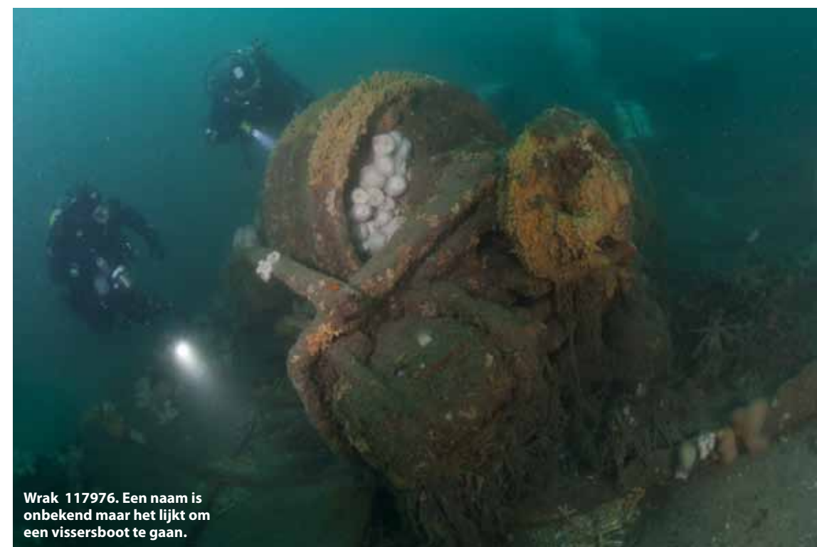
Wrak 117976. Een naam is onbekend maar het lijkt om een vissersboot te gaan.